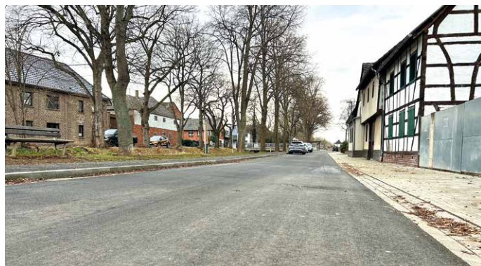
Die Prälat-Franken-Straße wurde im Rahmen des kommunalen Wiederaufbaus im Bereich zwischen Urbanusstraße und der Straße Am Vlattener Bach erneuert und vollausgebaut.

vorher auch nicht gab, sowie neue Wasserschieberkappen und Kanalschachtdeckel in die neue Asphaltdecke eingearbeitet. Die Kosten für den kompletten Vollausbau belaufen sich auf rund 500.000 Euro.